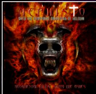
DVD + CD 2015