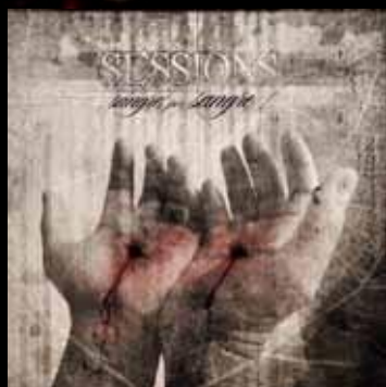
Sangre Por Sangre (2012)

https://www.youtube.com/sessionsmetal https://www.facebook.com/sessionsmetal Instagram @sessionsmetal