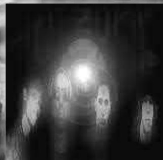
HOT ZONE "Malas experiencias" (Demo/2008) Independiente El lenguaje del rap metal cubano.