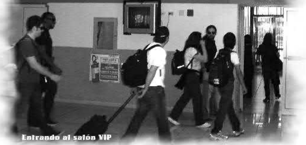
Entrando al salón VIP