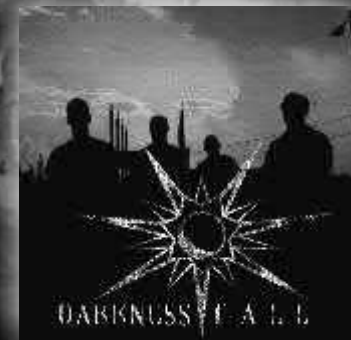
DARKNESS FALL "Darkness Fall" (Demo/2008) Independiente Metal-core con referencias melódicas.