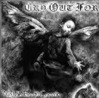
CRY OUT FOR "No mientas a tu corazón" (Demo/2008) Independiente Metal melódico con notables influencias del power metal.