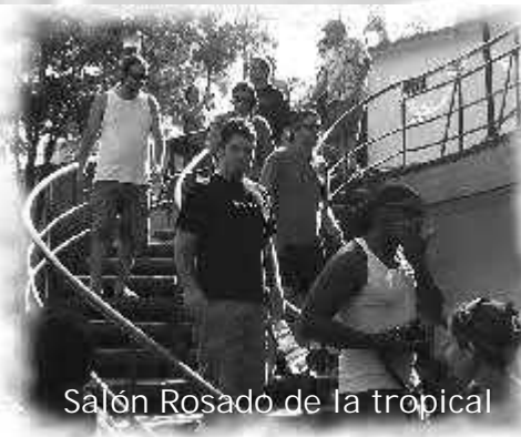
Salón Rosado de la tropical

A: Estamos muy sorprendidos con lo que presenciamos en la tarde de ayer y sobre todo con la relación entre los músicos. Se veía que todos tienen mucha práctica y mientras tocaban