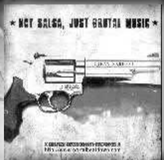
"Not Salsa, Just Brutal Music" (Comp-CD/2008) Brutal Beatdown Rec Una de las pocas caras del metal cubano.