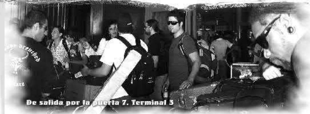
De salida por la puerta 7. Terminal 3

Ya parados en la puerta de salida de pasajeros una señora entrada en la cuarta o quinta década de vida comentó delante de nosotros: ... esta gente me dejó aquí sola y no conozco a nadie. Ahora cuando salgan los del grupo yo no sé quién es quien... Con un aire un poquito comierdón le dije: ...no se preocupe señora que yo le aviso cuando salgan los músicos... Ella, con una frescura del carajo y para contrarrestar mi altanería, me contestó: ...yo me refiero al equipo técnico que viene con ellos porque los músicos no van a salir por aquí. Ellos van directo al salón VIP... My brother, el