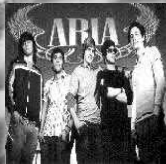
ARIA "Un nuevo yo" (Demo/2008) Independiente La freseura del neo-punk urbano con tintes pop.