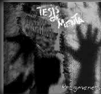
TESIS DE MENTIA "Fragmentos" (CD 2008) Colibrí Rec Un rock ecléctico conjugado con textos de muy buena factura.