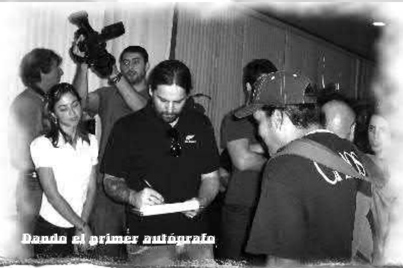
Dando el primer autógrafo

SEPULTURA llegaba a Cuba el jueves 17 de julio a las tres y veinte de la tarde en un vuelo procedente de Panamá que aterrizó por la Terminal 3. Estuvimos en el aeropuerto desde las 1:30 PM porque la señorita que trabajaba en el buró de Información olvidó decirle a nuestra madre que ese día arribaban tres vuelos procedentes de la tierra del General Omar Torrijos. Aprovechamos la espera de casi dos horas para apaciguar la sed con un refrigerio y para calmar la ansiedad adquirimos una cajetilla de cigarros. Al desenfundar el primer rubio tatuado de marca Monterrey avistamos al único fanático del grupo que fue a recibirlos esa tarde, el único que no fue al aeropuerto porque tenía que trabajar; incluso llevaba una tablilla con los nombres de cada integrante y de esa manera arrebatarles un autógrafo.