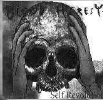
BLOOD HERESY "Self Revolution" (Demo/2008) Independiente Los rostros de metal-core matancero.