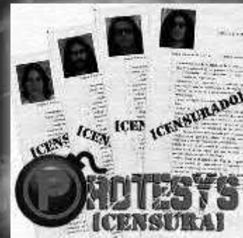
PRÓTESIS "Censura" (Demo/2008) Independiente Potente mezcla de hardcore y metal.