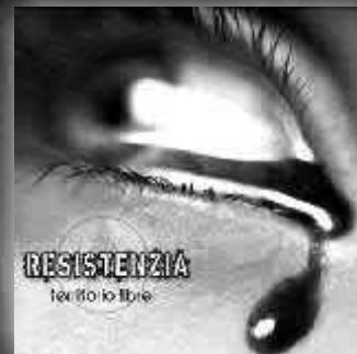
RESISTENZIA "Territorio libre" (Demo/2008) Independiente Hard-core proveniente del centro del país.