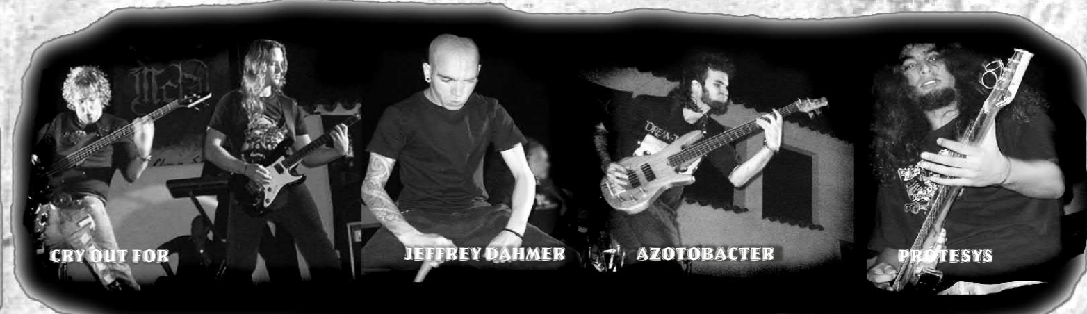
CRY OUT FOR