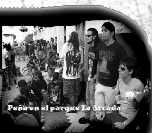
Peña en el parque La Arcada