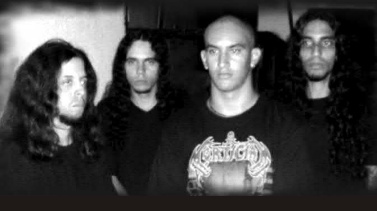
MORTOURY "Goresex" (Demo/CD/2008) Independiente

Primeramente debo acotar que este segundo demo supera con creces al anterior "Rustic Sex". Como se habrán podido percatar, la temática principal de los holguineros es el sexo y todo lo relacionado con la sangre, clasificada en el argot brutal como porno-gore y ejecutada musicalmente a través de un rápido death grind. Cuando hacía mención a la rapidez, no lo escribía en balde, porque los cimientos de la música en MORTOURY están basados en la velocidad, y como oasis entre tantas fusas y semifusas, se agradecen contados bloques densos, parte-cuellos o a medio tiempo que hacen de "Goresex" una obra más balanceada. El demo se integra de cinco cortes que duran once minutos y algunos segundos más y fue tutorado por Alex Parra (gtr en JEFFREY DAHMER). Esta atrocidad musical, como ellos mismos gustan llamarse, a pesar de tener las influencias de