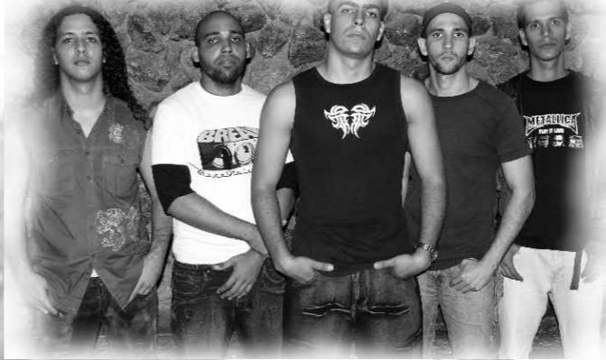
DARKNESS FALL "Darkness Fall" (Demo/CD 2008) Independiente

Si bien sentimos pesar cuando nos llega la noticia de la disolución de algún conjunto de rock, por otra parte, nos llena de regocijo la formación de otro grupo proveniente de los restos del anterior. Al menos el amor por el rock se mantiene, lo que cambia es la manera de expresarlo. Tal ha sido el caso de DARKNESS FALL, que dos de sus integrantes engrosaron las filas de los extintos blackmetaleros