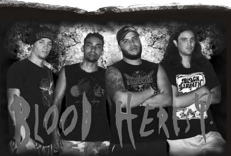
BLOOD HERESY "Self Revolution" (Demo/CD 2008) Independiente