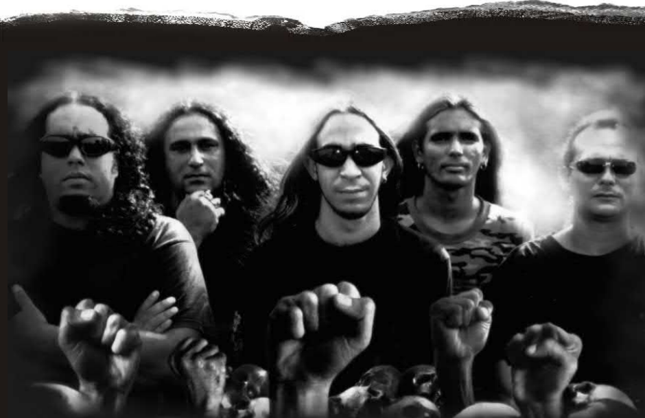
CONGREGATION "Become Stronger" (Demo/2008) Independiente

Me alegro enormemente que esta grabación haya salido en formato de demo promocional porque CONGREGATION está a tiempo de subsanar deficiencias antes de involucrarse con un producto más largo. Lo primero que deben hacer es buscar la forma de grabar con