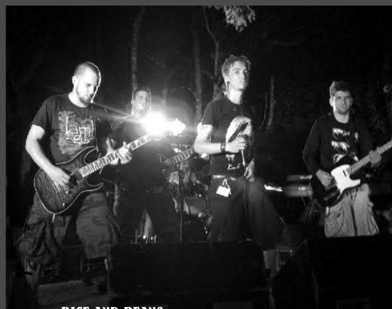
RICE AND BEANS