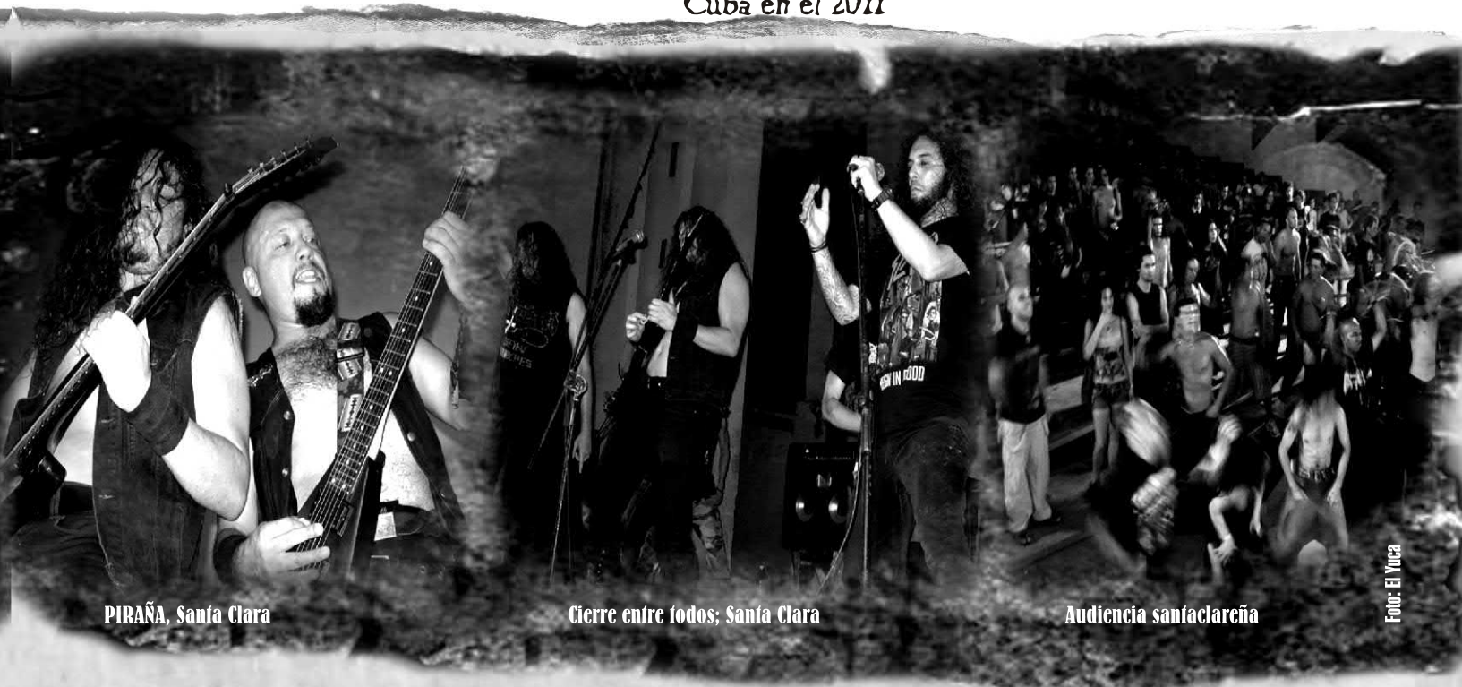
PIRAÑA, Santa Clara