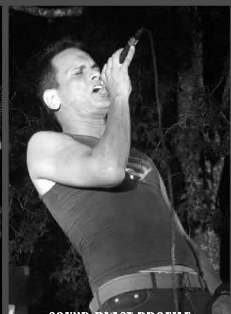
SOUND BLAST PROFILE

presenciar lo acontecido la noche inaugural por razones ajenas a nuestros deseos. No obstante, nos hicimos eco de muchos que sí vivieron esa jornada hasta la salida del Sol, criterios mediados por intransigencias musicales en algunos casos y etilizados en la mayoría, pero que coincidían en lo insólito de ver a una banda como UNLIGHT DOMAIN tocar "TNT" de los aún vitales AC/DC, junto a títulos emblemáticos